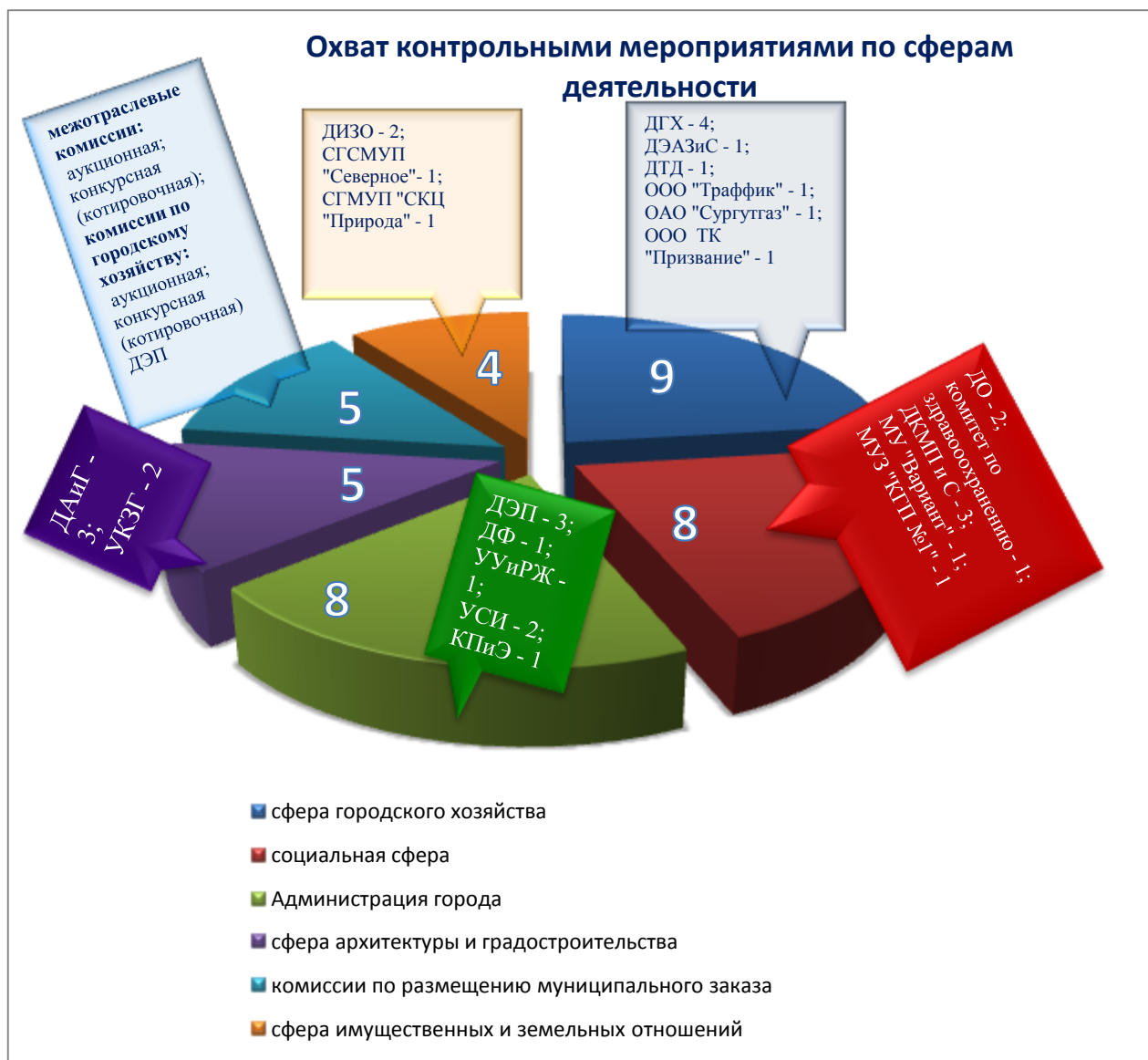
Диаграмма 2. Охват контрольными мероприятиями по сферам деятельности

Контрольно-ревизионными мероприятиями (проверками) в отчётном году охвачено 11 993 млн. рублей или 68,5 % от расходов городского бюджета на 39-ти объектах контроля по шести сферам деятельности (диаграмма 2).