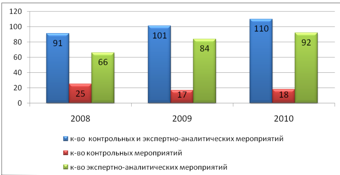
Диаграмма 1. Динамика количества контрольных и экспертно-аналитических мероприятий

Общий объём выявленных финансовых нарушений и нарушений порядка управления и распоряжения муниципальной собственностью в 2010 году составил 500 971,8 тыс. рублей.