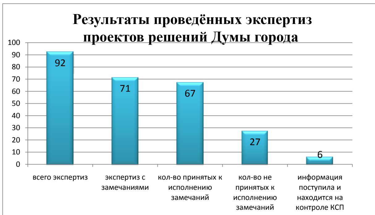
Диаграмма 5. Анализ результатов проведённых экспертиз проектов решений Думы города

По результатам проведённых экспертно-аналитических мероприятий отменён 1 нормативно-правовой акт, внесены изменения в 5, издано вновь 3.