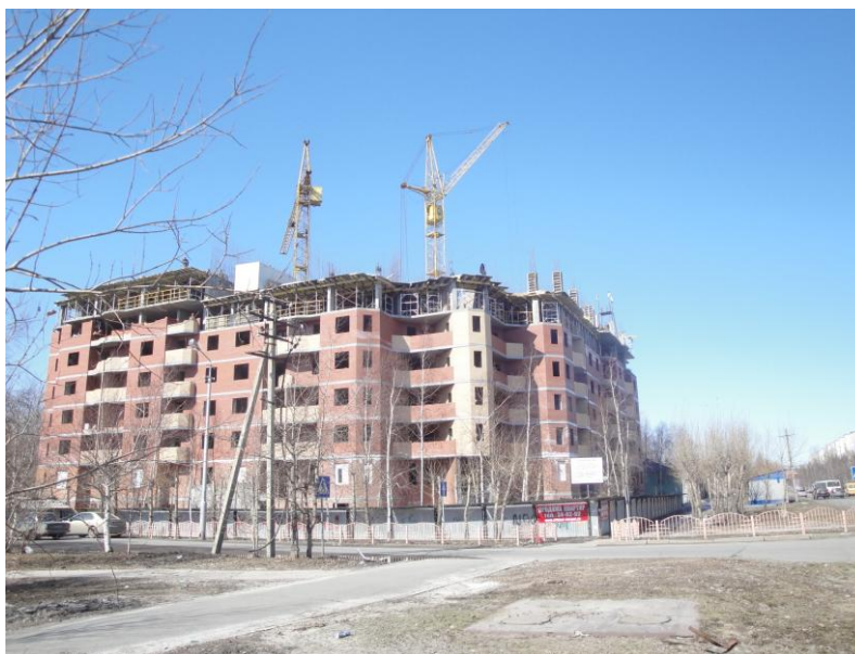
строительство 16-этажного дома

Решением Думы от 29.12.2009 № 665-IV ДГ «О внесении изменений в решение Думы города от 27.02.2007 № 165-IV ДГ «О привлечении кредита Европейского банка реконструкции и развития» изменены условия привлечения заемных средств (изменен срок кредитования - 9 лет и льготный период кредитования – 4 года, установлена фиксированная процентная ставка).