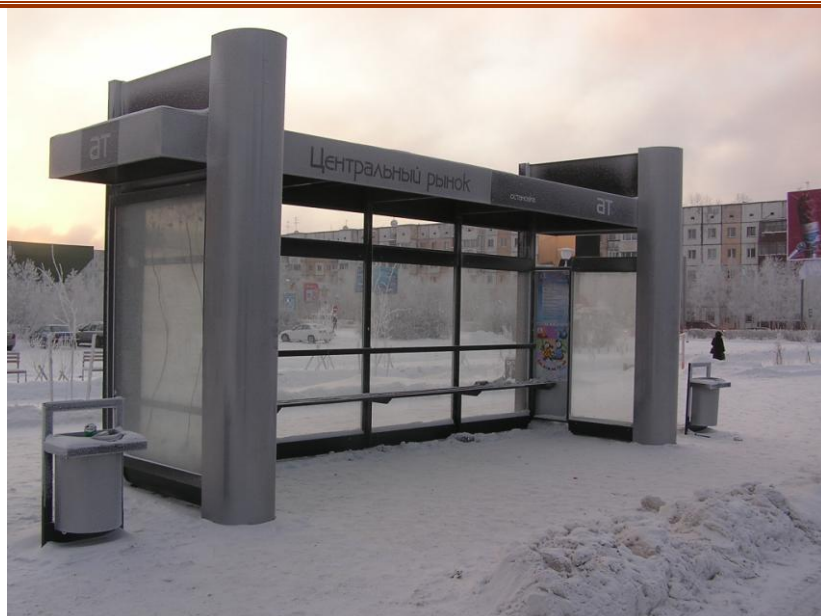
остановка «Центральный рынок»

- в бюджете города на 2009 год предусмотрены бюджетные ассигнования в размере 3 300 тыс. рублей на приобретение 15 автопавильонов, определены места на остановочных пунктах городских улиц для установки новых муниципальных павильонов без торговой площади (10 остановочных павильонов планируется установить на свободных посадочных местах, 5 павильонов – после освобождения земельных участков, занимаемых частными павильонами). В районе здания Управления социальной защиты населения по г.Сургуту (пр. Мира) на остановке общественного транспорта установлен новый типовой муниципальный остановочный павильон. В комплекс типового остановочного павильона входит павильон, две урны, скамейка, лайт-бокс. Новые остановочные пункты также на остановках: «пр. Мира», «Центральный рынок», «Трансагенство», «маг. «Даниловский»; «Дом творчества юных», «ул. Мелик-Карамова»; «10 мкр.»; «мкр.ПИКС», «ул. Грибоедова»; «маг.«Восход»; «кинотеатр «Аврора», «маг. «1000 мелочей», «ул. Энергетиков»;