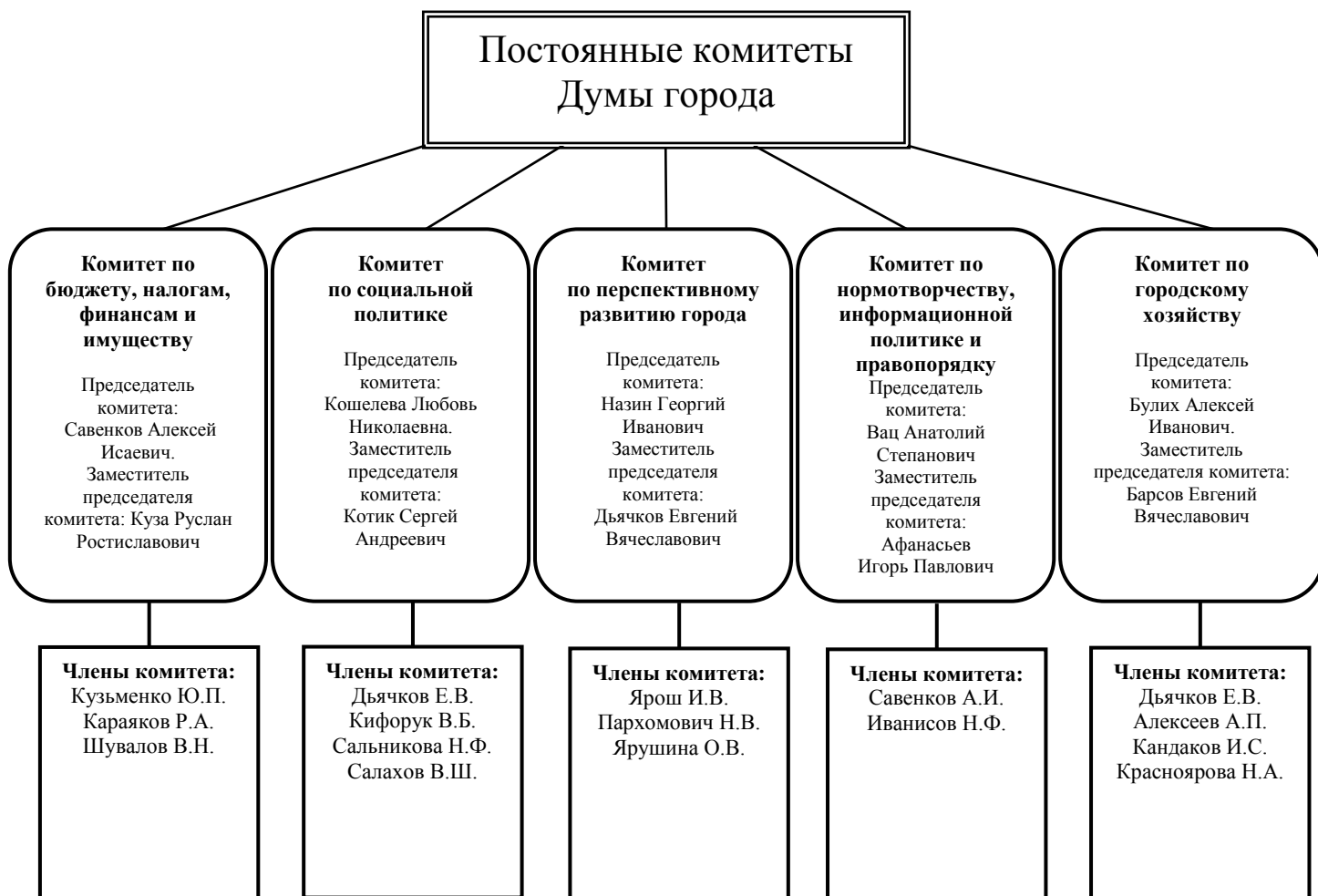
Рисунок 1. Состав постоянных комитетов Думы города в 2009 году

Решением Думы города в декабре 2009 года объединены постоянные комитеты Думы по перспективному развитию города и по городскому хозяйству. Таким образом, с 2010 года в Думе города будут осуществлять свою деятельность четыре постоянных комитета.