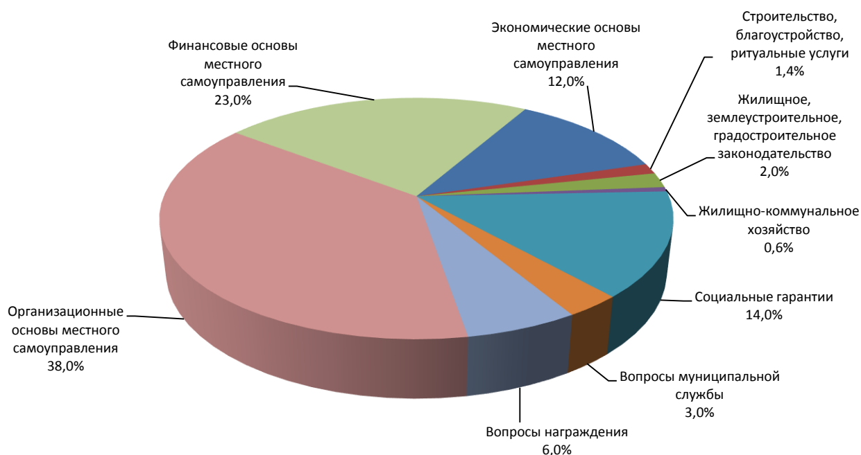
Отраслевая структура решений Думы города, принятых в 2016 году

Решениями Думы города утверждаются ежегодные отчёты должностных лиц Администрации города о проделанной работе и выполнении ранее принятых решений Думы (отчёты о выполнении прогнозного плана приватизации муниципального имущества, об исполнении бюджета города, о работе муниципальных унитарных предприятий, о результатах деятельности Администрации города и Главы города).